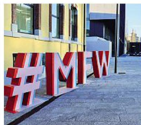
Immagini Sopra l'opera dedicata alla Fashion Week da vedere con gli occhiali 3d dell'artista Pongo fuori dal Museo del Design (Cherchi). Sotto e a fianco il ritorno in città di turisti e operatori di moda (LaPresse)

Una top model è stata colpita al volto da un uomo che ha tentato di rapinarle il cellulare