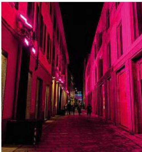
In attesa In alto, la preparazione di una modella. Sopra, luci in via della Spiga in attesa delle sfilate

La proprietà intellettuale è riconducibile alla fonte specificata in testa alla pagina. Il ritaglio stampa è da intendersi per uso privato